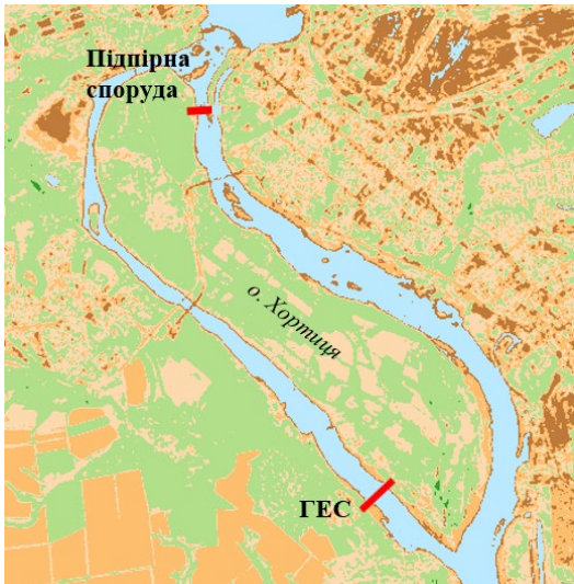
Рис. 1. Ілюстративний приклад розміщення дериваційної ГЕС в межах острова Хортиця в м. Запоріжжя (модель SAVI на основі Landsat 8 від 14.07.2024)

Інший ілюстративний приклад застосування природоорієнтованого рішення наведено на рис. 2, де показано варіант розміщення руслової ГЕС на Дніпрі та обхідного рибохідного каналу у вигляді штучного русла-рукава в межах Конських плавнів Великого Лугу. Цей канал може також виконувати функції водопропускної споруди, зокрема з метою підводу води до водоспоживачів на лівобережжі колишнього водосховища. По трасі каналу можуть облаштовуватися озера, затоки і протоки, а також насосні станції для заповнення берегових наливних водосховищ тощо.